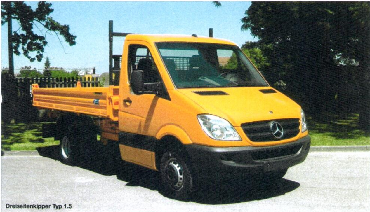
Dreiseitenkipper Typ 1.5