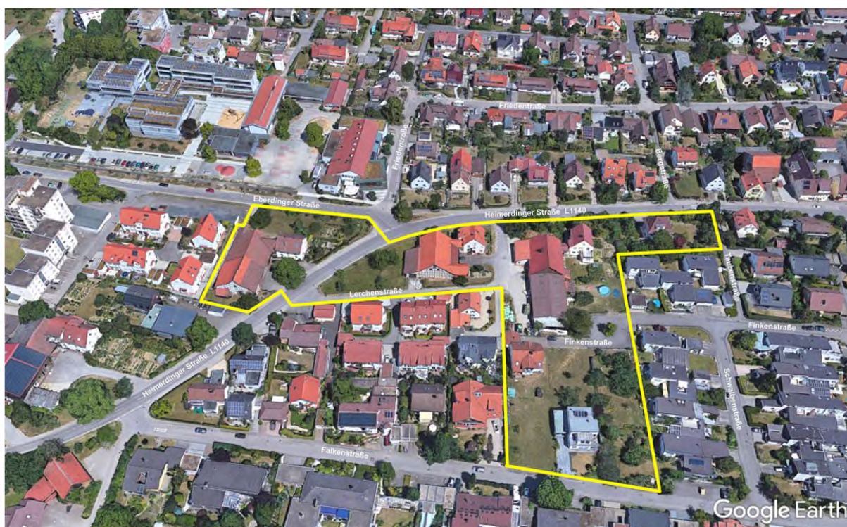
Schrägluftbild mit Planbereich (gelb)