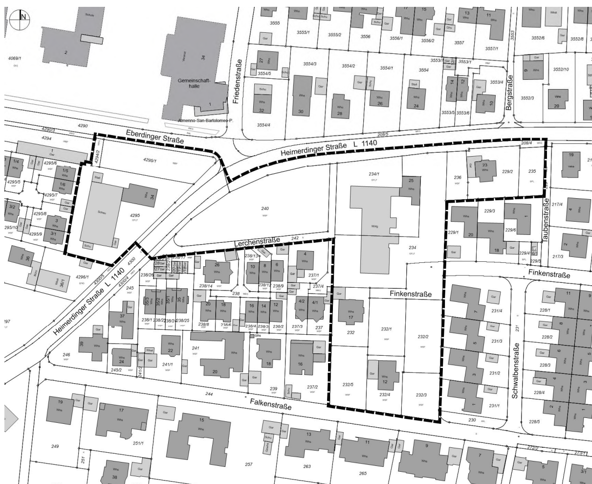
Abgrenzung räumlicher Geltungsbereich Bebauungsplan „Erweiterung Vogelgebiet“ (ohne Maßstab)

Die landwirtschaftlichen Nutzungen sind an beiden Standorten nicht mehr entwicklungsfähig. Mittel- bis langfristig ist zu erwarten, dass diese Nutzungen in den Außenbereich verlagert werden müssten, um in Zukunft wirtschaftlich betrieben werden zu können. Der Eigentümer des Hofes Heimerdinger Straße 34 hat bereits Ende 2019 öffentlich-rechtlich auf einen Teil der genehmigten landwirtschaftlichen Nutzung verzichtet.